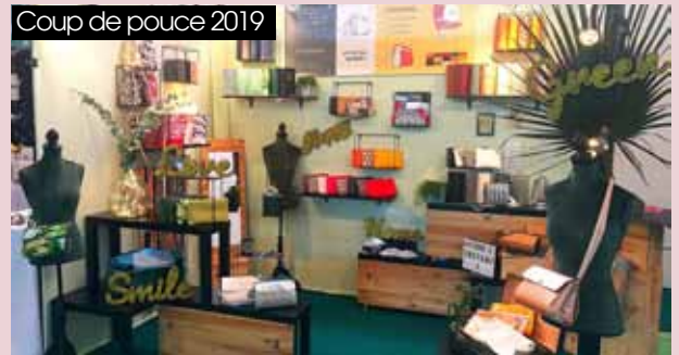
Coup de pouce 2019