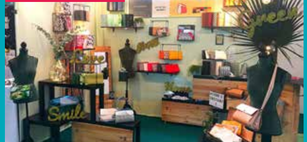
Coup de pouce 2019